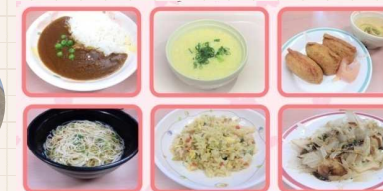
セレクトメニュー (一例)