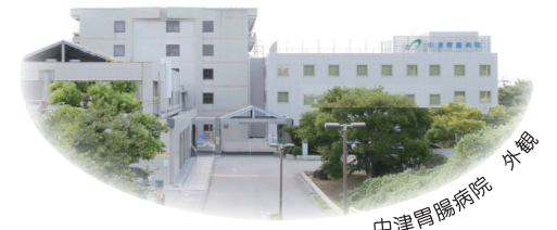
中津胃腸病院 外観