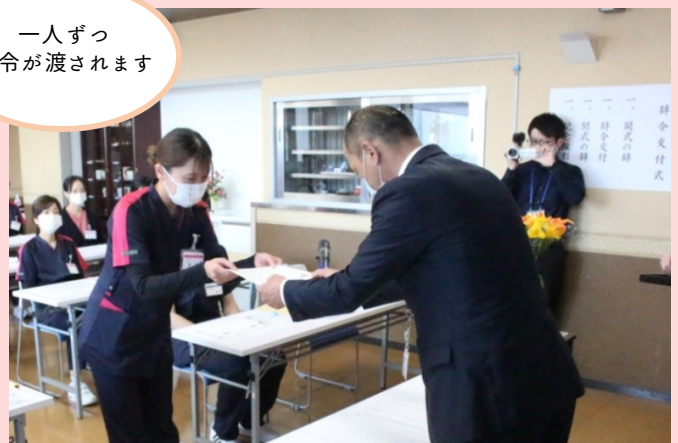
一人ずつ 辞令が渡されます

期待と緊張の混じった面持ちで初出勤です。院長からのお話にはじまり、辞令交付式へと進みます。一人ずつ辞令を受け取り、本日より中津胃腸病院の職員としての一歩を踏み出しました。