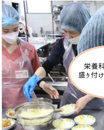
栄養科(厨房)では盛り付けや切り込みを体験