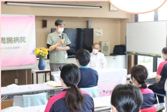
ようこそ 中津胃腸病院へ

新入職員合同研修では病院の理念や方針、さらに医療安全や感染対策などの基礎知識についても学びました。また、各部署を見学し多職種の業務内容や役割を知ることができました。今年度の研修ではグループワークや実技を多く取り入れました。1週間の研修を通して入職者同士の関係を築くことができましたようです。研修後は各部署に配属され、先輩たちの指導のもと業務に励んでいます。まだまだわからないことが多いと思いますが、仲間とともに乗り越え、自分の力を発揮できるようになってほしいと思います。