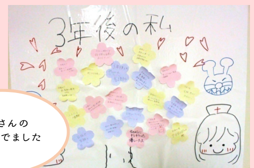
たくさんの意見ができました