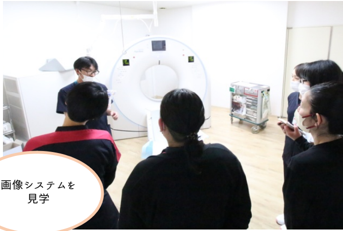
画像システムを見学

病院は様々な部署から成り立っており、各部署の業務や様子を知ることによって病院全体の流れがわかり、コミュニケーションもとりやすくなります。自分の職種以外の業務は知らないことが多く、とても勉強になります。