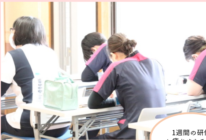
1週間の研修お疲れさまでした

オリエンテーションを通して学んだことを振り返り、グループごとに発表を行いました。1週間ともに研修を受けた入職者の皆さん。活発に意見を出し合うことができました。これからも話し合い、協力し合える仲間として励んでほしいと思います。